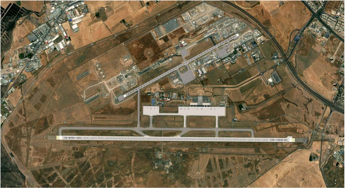
Erbil International Airport met onder in beeld het civiele deel en boven het zwaarbewaakte militaire gedeelte, Erbil Airbase (EAB).

Bovendien is besluitvorming vanwege de Koerdische cultuur en de al eerdergenoemde politieke verdeeldheid, erg centraliseerd. Voor alle besluiten moet een schriftelijke order van de hoogste generaal of zelfs de minister van MoPA komen. Een simpele opdracht om munitie te verstrekken voor training kost weken. Een order om een aflossing van een eenheid te regelen, kost maanden. Voor grotere projecten is dus vaak druk van buitenaf nodig. Die druk komt vaak van de coalitie (want ook Bagdad is erg traag en heeft maar weinig invloed in Koerdistan) en moet vaak op het hoogste niveau (president, minister-president, minister, Chief of Staff, secretaris-generaal) uitgeoefend worden om grotere stappen te kunnen maken. Als adviseur kun je ideeën opperen wat je wilt, maar heel vaak wordt er gewezen naar uitblijvende beslissingen of autorisatie van bovenaf.