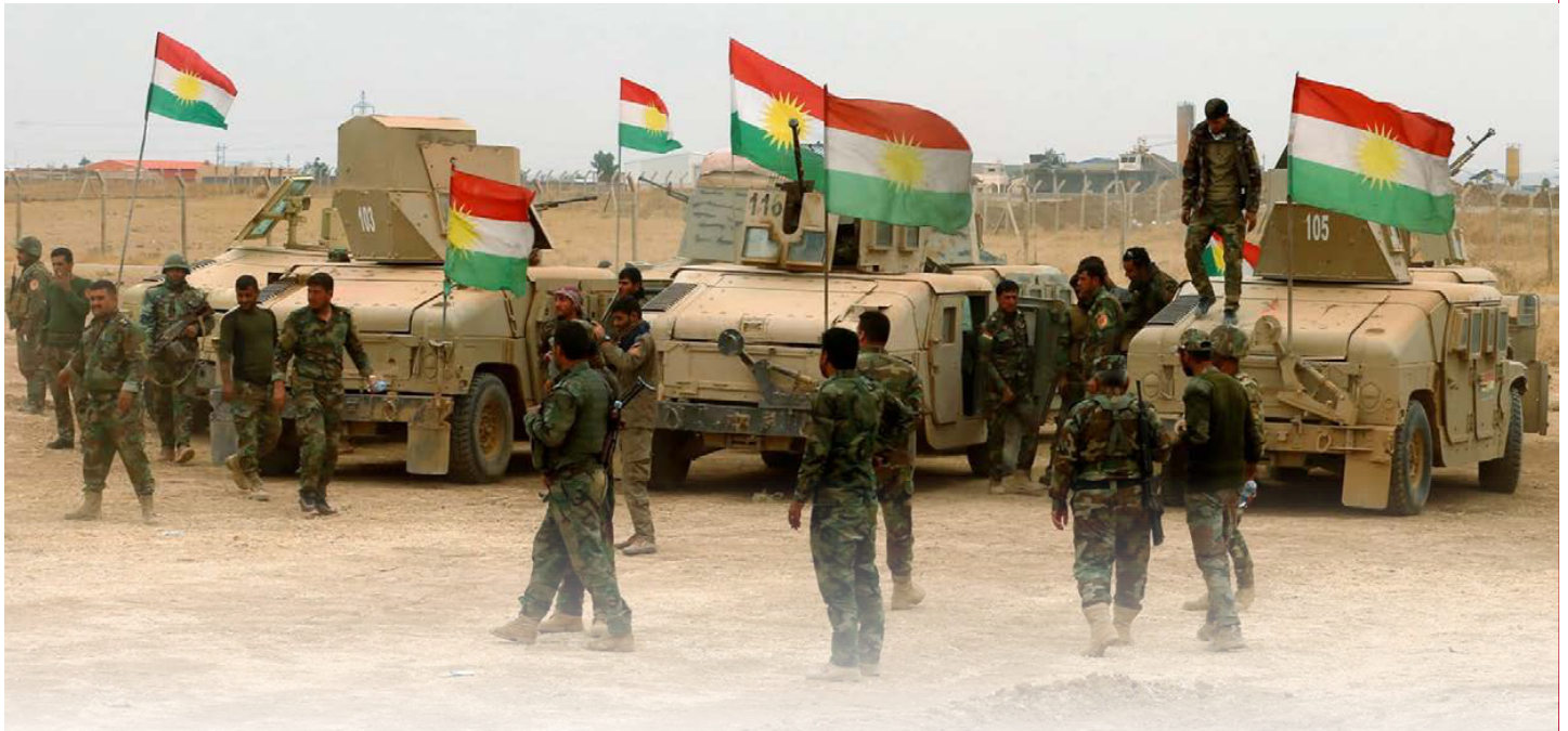
Onder druk van de internationale gemeenschap moeten de Koerden hun milities opgeven en onderbrengen in het Ministry of Peshmerga Affairs. Als beloning hiervoor krijgen ze wapens, munitie, uitrusting, kleding en geld om militairen te betalen.