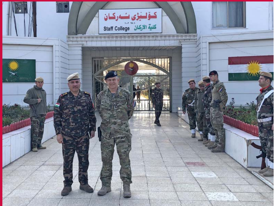
De Koerden maken continue foto's van je. Zowel voor publicatie op officiële Social Media pagina's als 'selfies'.

Nu wat over mijn ervaringen. De Koerden zijn vriendelijke mensen en staan open voor advies. Niet dat ze er altijd wat mee doen, maar ze ontvangen je tenminste gastvrij en nemen de tijd voor je. Bedienden vliegen af en aan met thee, koffie, water, koekjes en soms zelfs eten. Ze respecteren ons als adviseur en vragen ook vaak om advies. Westerse militaire denkbeelden worden hier gewaar-