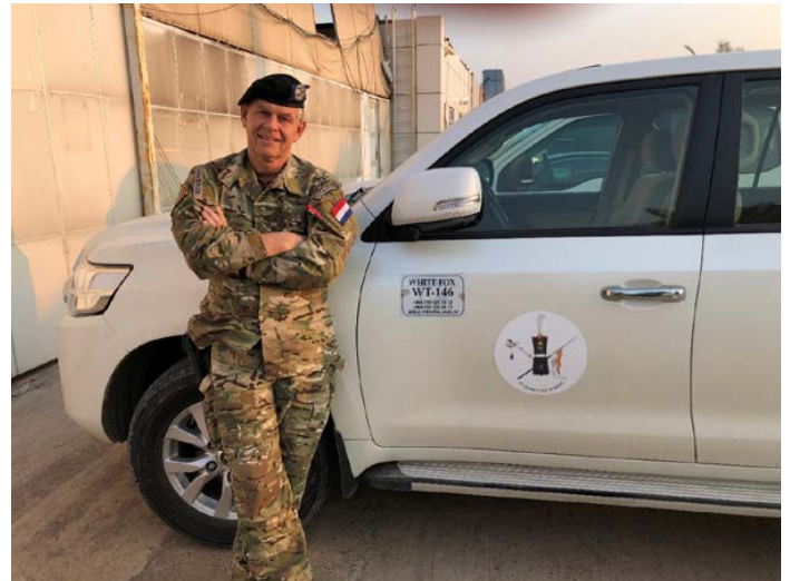
Daarnaast is het gewoon ontzettend leuk om weer op missie te zijn. Let op de sticker op de auto ...

Daarnaast is het natuurlijk gewoon ontzettend leuk om weer op missie te zijn. De omgang met internationale collega's is hartverwarmend en we lachen wat af. Ik ben omringd door Amerikanen, Britten, Duitsers, Italianen, Hon-