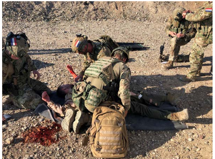
Medische training van de Nederlandse Force Protection compagnie

Nederland neemt dus deel aan de Capacity Building Mission in Irak (CBMI). Zo zijn er stafofficieren werkzaam in diverse functies binnen de Directoraten op de hoofdkwartieren in Koeweit en Bagdad. Daarnaast levert Nederland een Force Protection compagnie (FP Coy) die als taak heeft in een Amerikaans bataljonsverband op de vliegbasis in Erbil (Erbil Air Base - EAB) te beveiligen met wachtposten en een Quick Reaction Force. Ook levert deze compagnie mobiele zogenaamde Personal Security De-