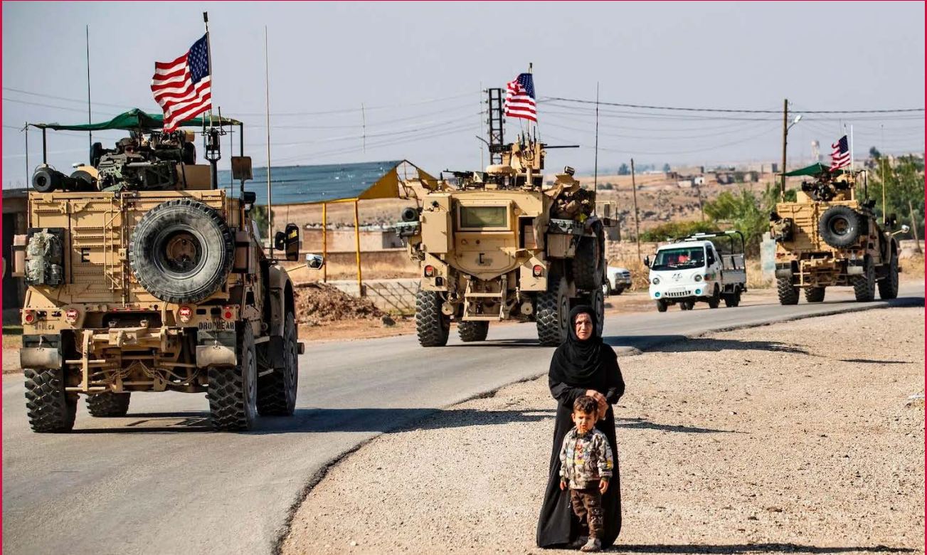
Op 17 oktober 2014 werd een Combined Joint Task Force opgericht om ISIS te bestrijden. De operatie kreeg de naam 'Inherent Resolve'. De inspanning is anno 2023 niet meer gericht op het verslaan van ISIS, maar op de capaciteitsopbouw van de Iraakse strijdkrachten.

verklaarde in 2018 de complete overwinning op ISIS te hebben behaald. Tussen 2018 en 2020 werden daarna alle gebieden in Irak en Syrië op ISIS heroverd. ISIS bestaat op dit moment dan ook slechts als een 'ondergrondse' organisatie. Op dit moment bevindt de operatie OIR zich in Fase IV, de 'normalize' fase. Dit betekent in feite dat het gros van de inspanning niet meer op het verslaan van ISIS is gericht, maar op capaciteitsopbouw van de Iraakse strijdkrachten om ISIS onder de duim te kunnen houden.